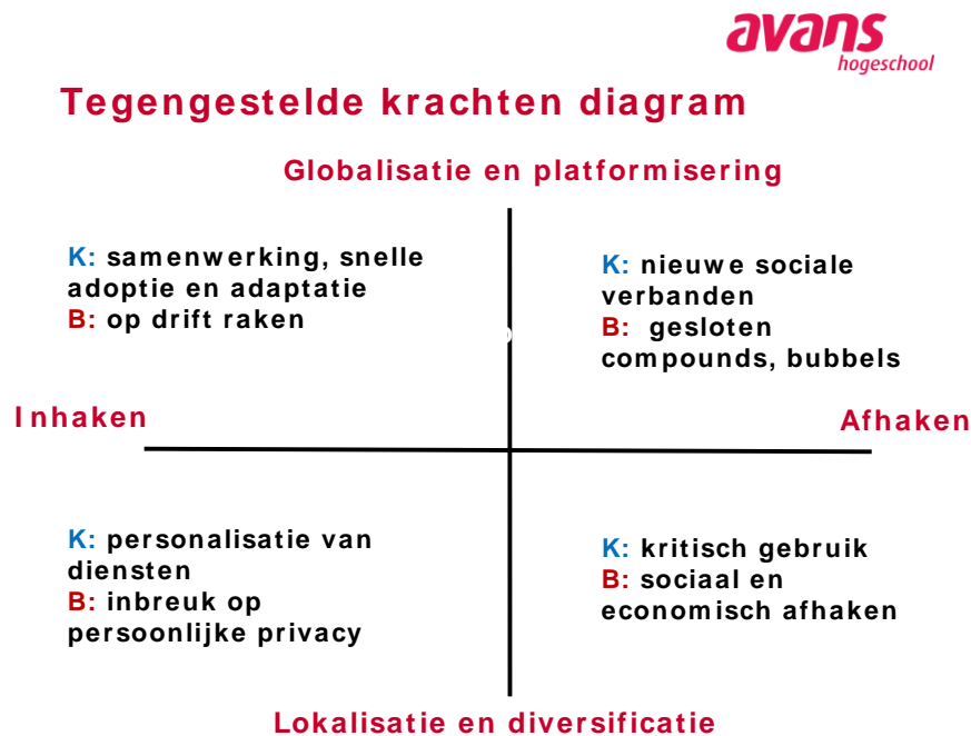
Figuur 7.1: tegengestelde dynamieken diagram

Het diagram laat zich op twee manieren gebruiken: